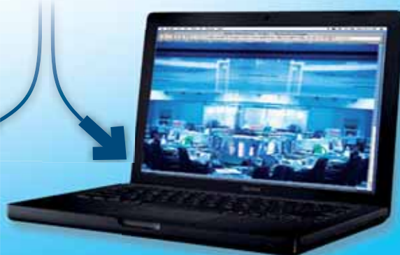
Tout ordinateur connecté (non fourni)