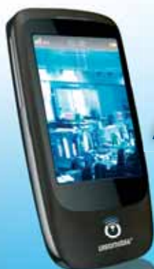
Votre TSM® Touch - en option - (Terminal de Sécurité Mobile Tactile)