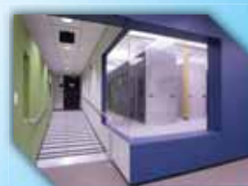
Stockage des images sur serveurs sécurisés distants

Pilotez vos sentinelles à distance via :