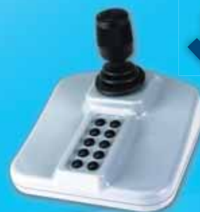
Votre joystick de pilotage - fourni -