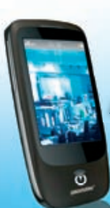
Votre TSM® Touch - en option - (Terminal de Sécurité Mobile Tactile)