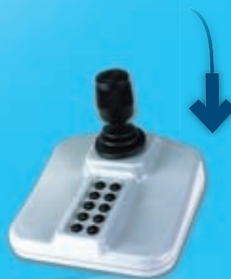
Votre joystick de pilotage - fourni -