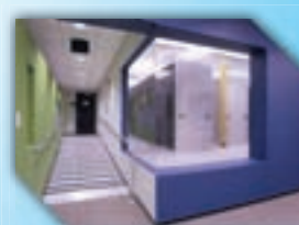
Stockage des images sur serveurs sécurisés distants

Pilotez vos sentinelles à distance via :