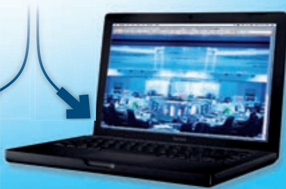
Tout ordinateur connecté (non fourni)